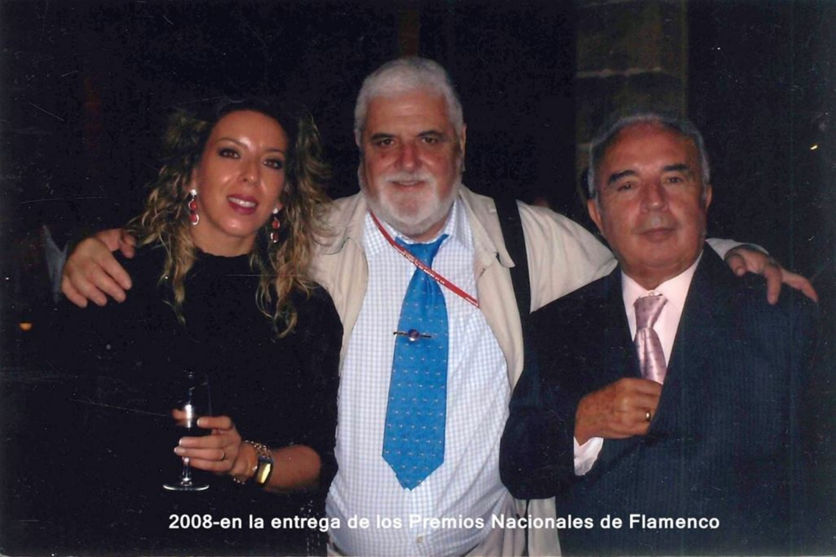
2008-en la entrega de los Premios Nacionales de Flamenco